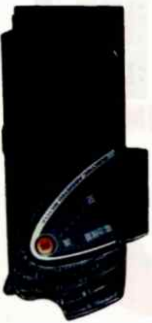
リチウムイオンバッテリー